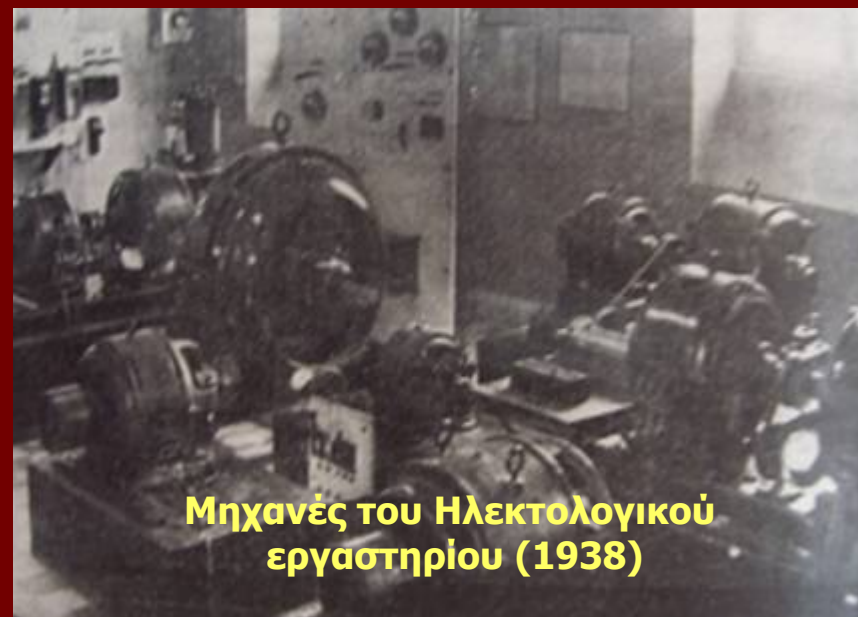
Μηχανές του Ηλεκτολογικού εργαστηρίου (1938)