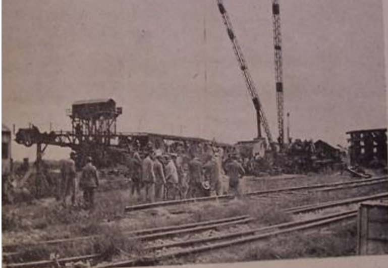
Οι έργομεις έπισκεπτόμενοι έγκαφία υπό έπισκεπτήν εις τό έργοστάσιον Μπανίτουσ