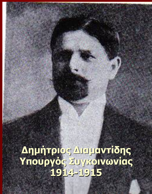
Δημήτριος Διαμαντίδης Υπουργός Συγκοινωνίας 1914-1915