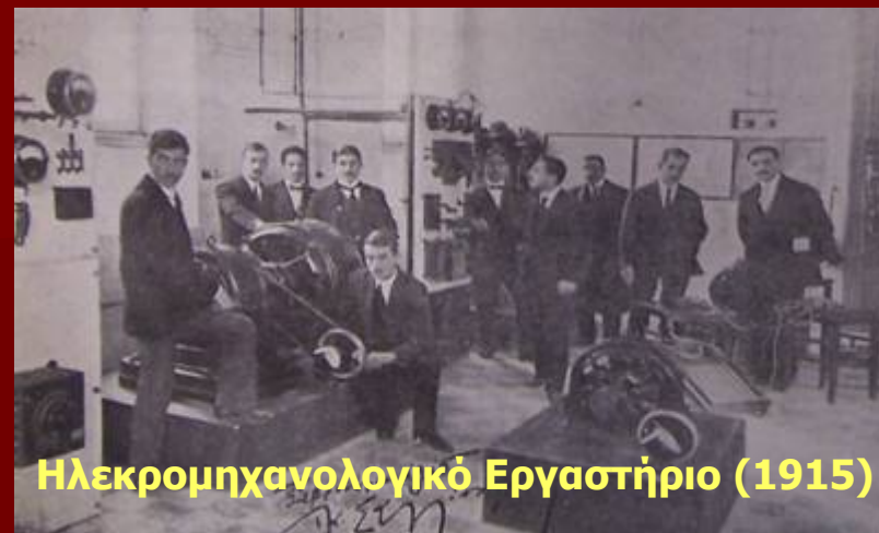
Ηλεκτρομηχανολογικό Εργαστήριο (1915)