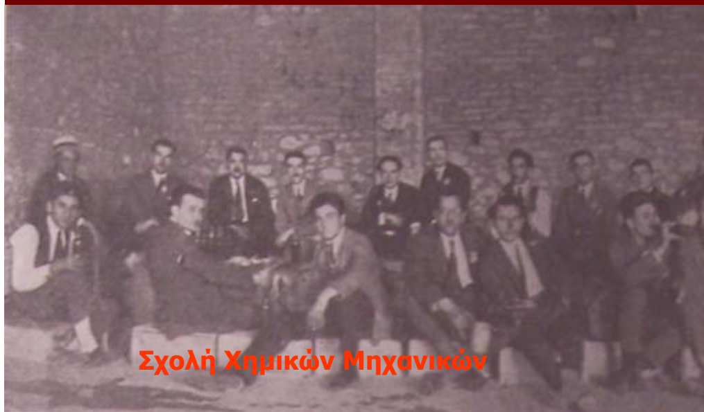
Σχολή Χημικών Μηχανικών