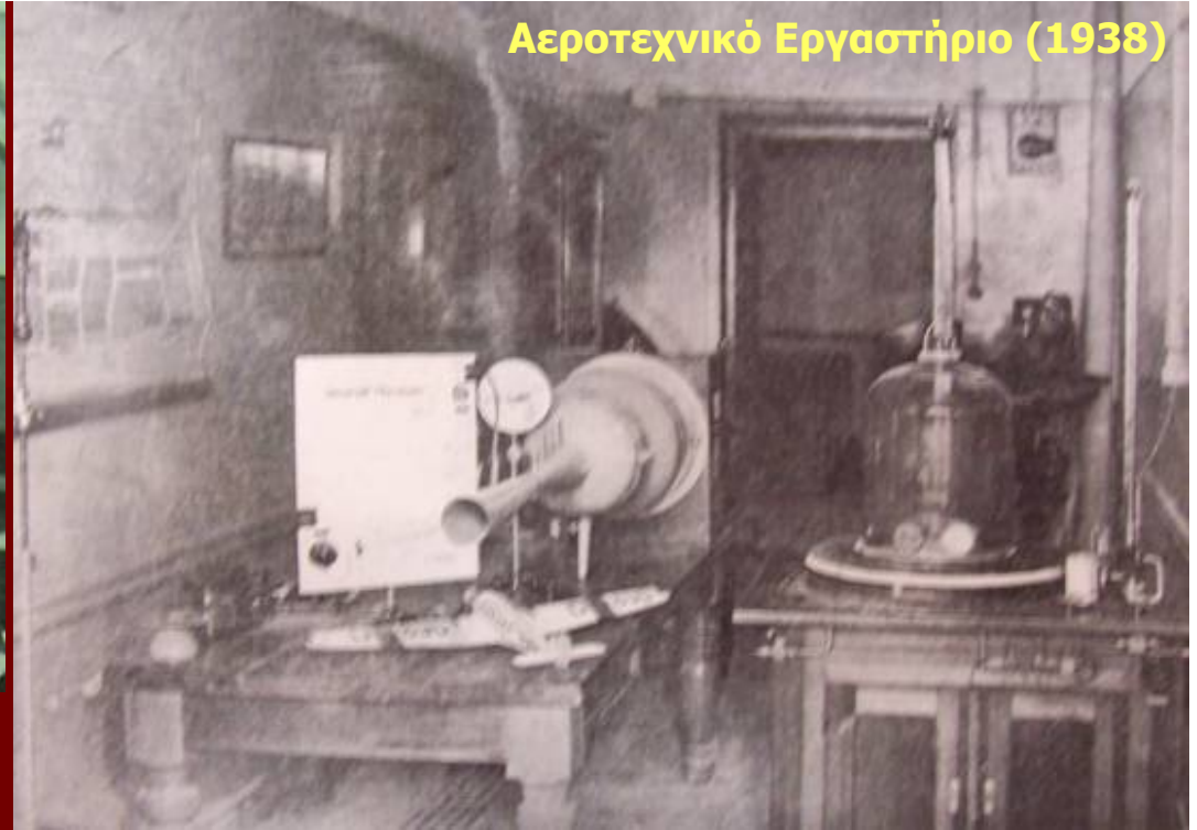
Αεροτεχνικό Εργαστήριο (1938)