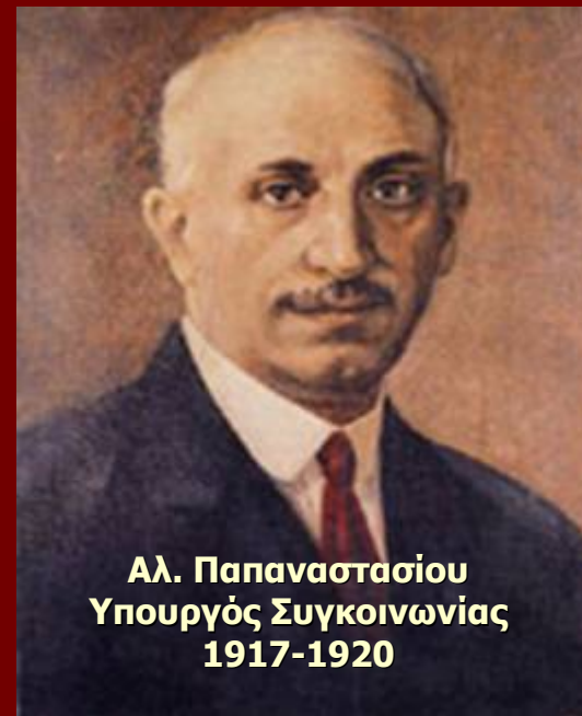
Αλ. Παπαναστασίου Υπουργός Συγκοινωνίας 1917-1920