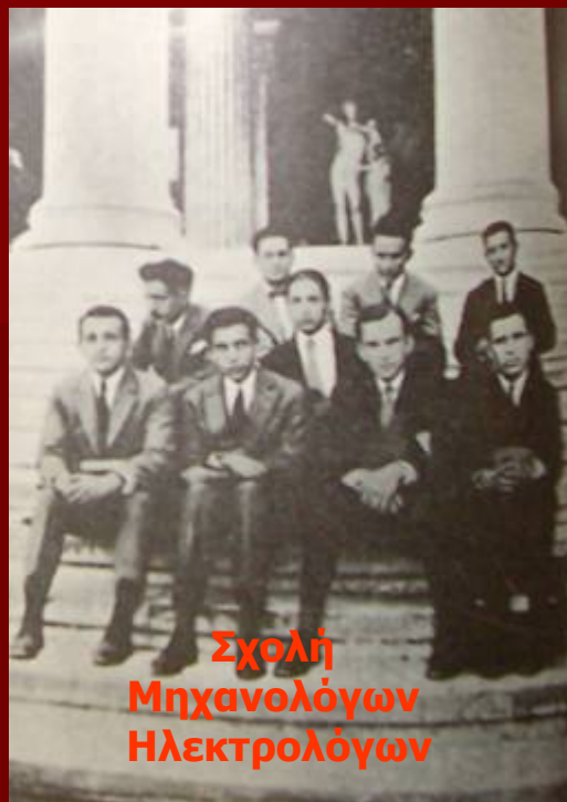
Σχολή Μηχανολόγων Ηλεκτρολόγων