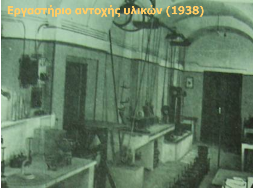
Εργαστήριο αντοχής υλικών (1938)