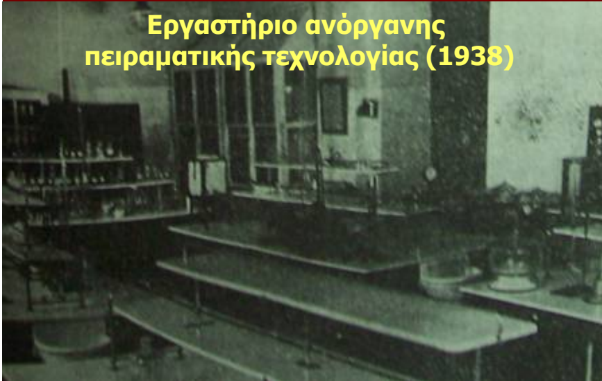
Εργαστήριο ανόργανης πειραματικής τεχνολογίας (1938)