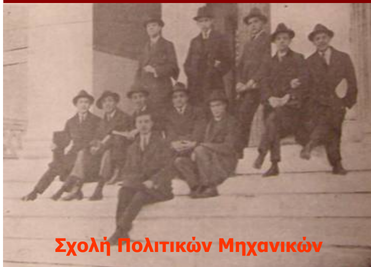
Σχολή Πολιτικών Μηχανικών